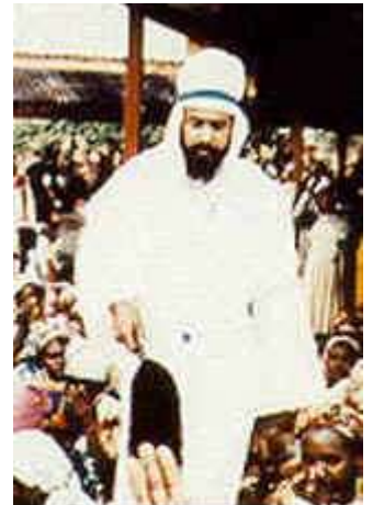
Maitreya as he appeared in Nairobi, in 1988