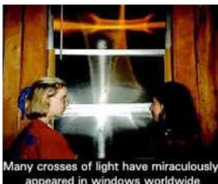
Many crosses of light have miraculously appeared in windows worldwide

V červnu 1988 jeden ze spolupracovníků Maitréji naznačoval, že znaky Jeho přítomnosti ve světě se budou množit. "Chystá se zaplavit svět takovými událostmi, které lidská mysl nepochopí." Plačící a krvácející sochy, léčivé světelné kříže a prameny, vzkazy, napsané na semenech plodů a zelenině, bronzové a kamenné sošky, které jakoby pily mléko - skrze tyto neustále se množící zjevení, která jsou často uváděna v médiích, se dotýká srdcí milionů lidí, a tímto je připravuje na svůj brzký příchod. Tyto zázraky také posilují lidskou naději a očekávání věcí příštích.