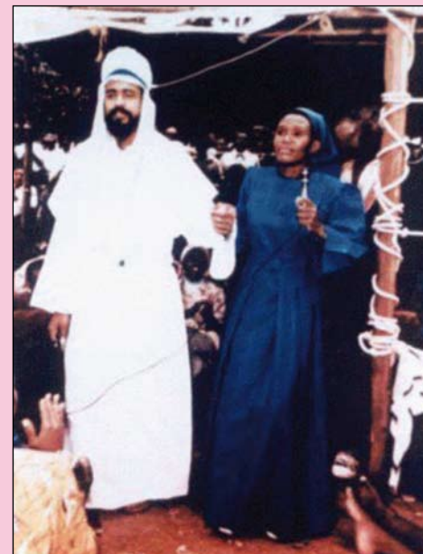
Nairobi 1988. Shromáždění křesťanů jej poznává jako Ježíše.

se a pracuje zdánlivě jako obyčejný člověk. Jen málokomu je známá jeho pravá totožnost. Nechce narušovat naši svobodnou vůli, a proto na veřejnost vychází postupně. Maitréja je člověkem dnešní doby a zabývá se aktuálními problémy lidstva. Informace o Maitréjově příchodu se objevily na veřejnosti v posledních desetiletích hlavně díky panu Benjaminu Creme, britskému esoterikovi a umělci, který již od roku 1974 mluví o této nejvýznamnější události naší doby. Maitréja působí od roku 1977 na mnoha neveřejných i veřejných úrovních